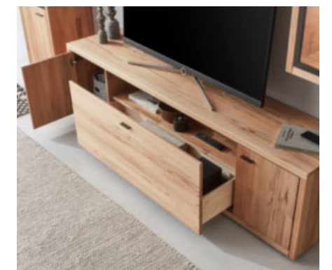
Lowboard mit viel Platz für TV-Gerät & Co.