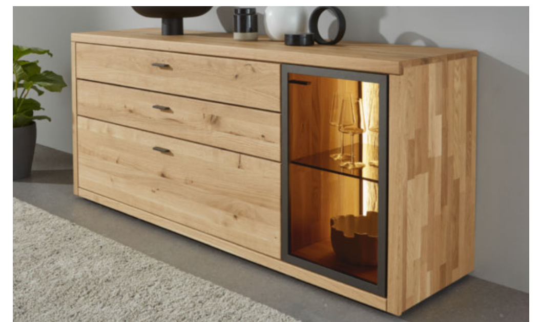
Akzentrückwand mit LED-Beleuchtung