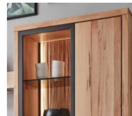
optional mit Akzent-Rückwand