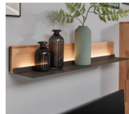
Wandboard mit LED-Beleuchtung