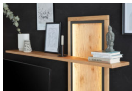
Aufsatzpaneel als Designhighlight