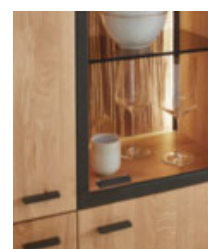
Griffe & Rahmen aus edlem Metall