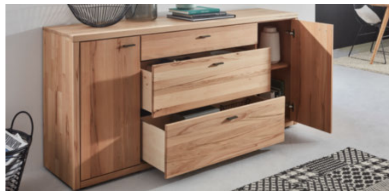
Sideboard mit großzügigem Stauraum