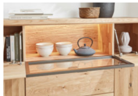
hervorragender Zugriff dank Klappe