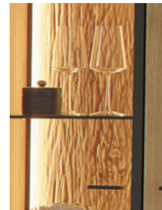
perfekt beleuchteter Natur-Look