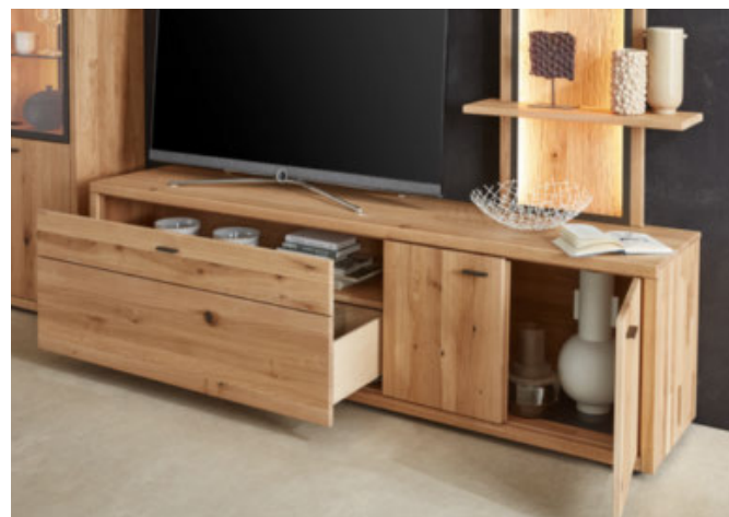
wertvoller Stauraum im TV-Lowboard